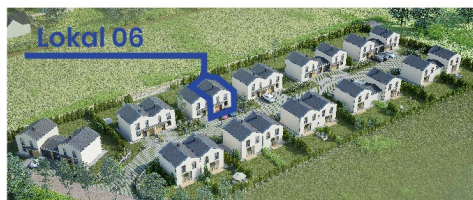
Widok osiedla z lotu ptaka